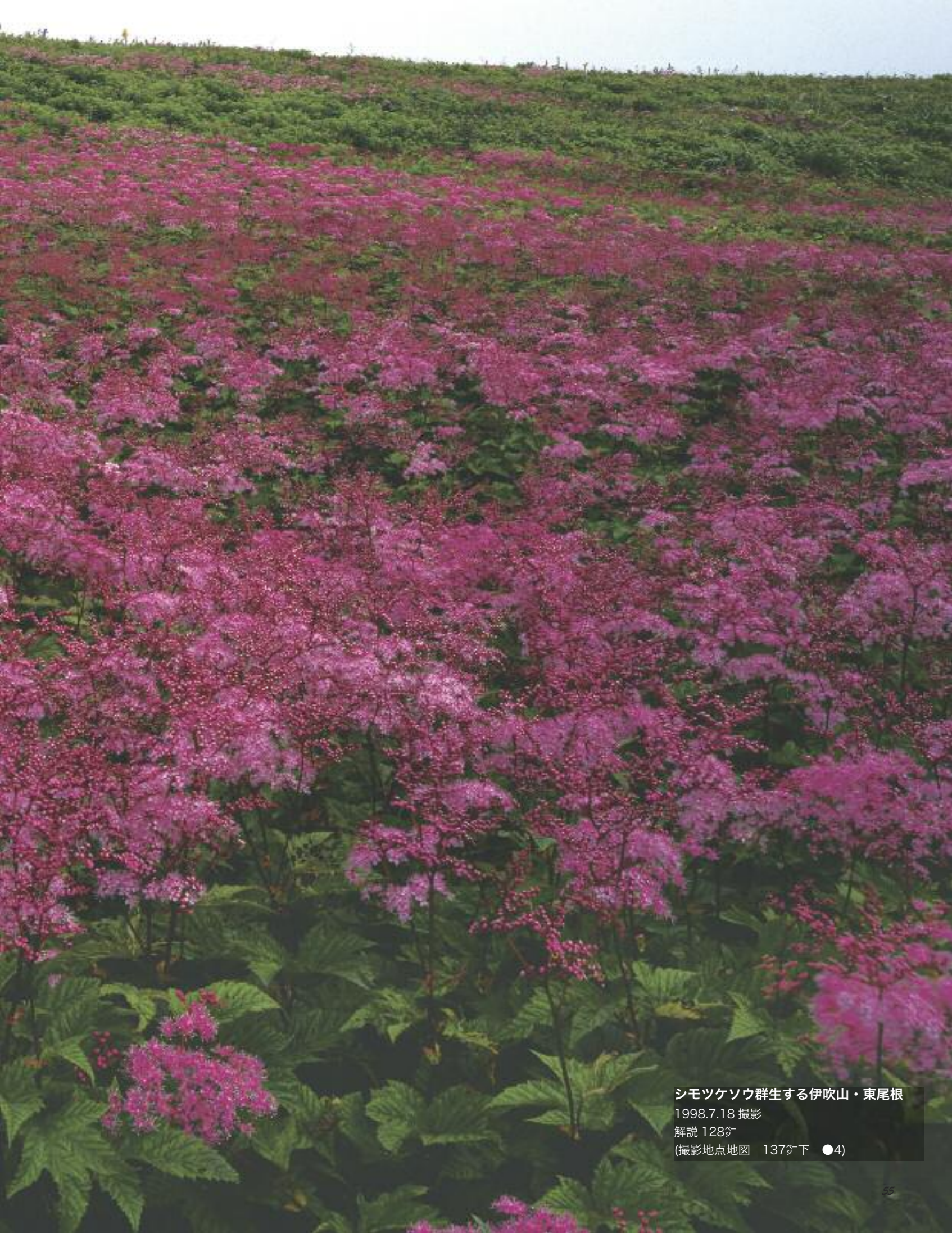
シモツケソウ群生する伊吹山・東尾根 1998.7.18 撮影 解説 128頁 (撮影地点地図 137頁下 ●4)