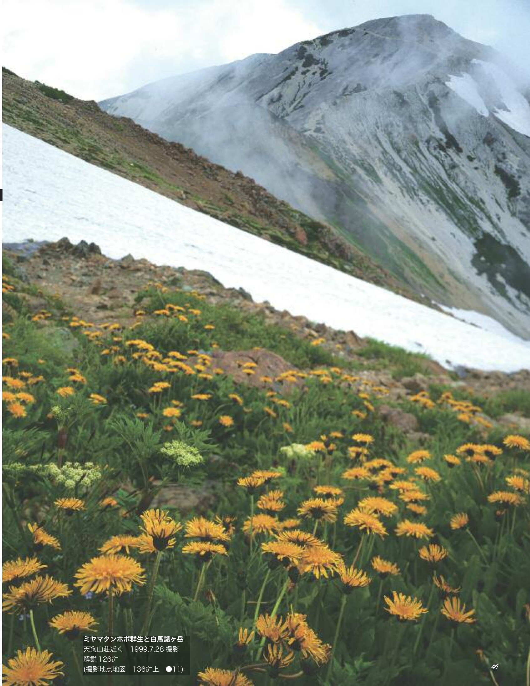
ミヤマタンポポ群生と白馬鍵ヶ岳 天狗山荘近く 1999.7.28 撮影 解説 126頁 (撮影地点地図 136頁上 ●11)