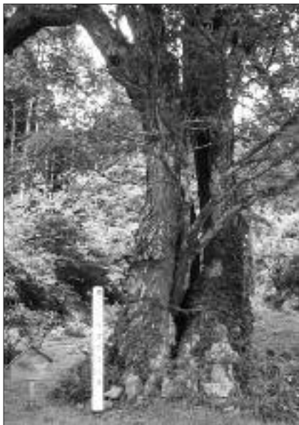
◀写真 F-006 ゆきまさ 行政のフジキ 「重定のフジキ」とも。 根元で2分岐する樹形。 (写真・Web 画像)