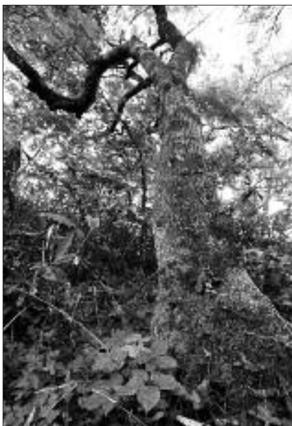
写真 SG-001 C 評価

※巨木となるものは稀で、「龍頭のソヨゴ」は希有な存在であった。根元周囲 6m で、10 分岐していたが、調査時の 2014 年には主幹を残すのみ。