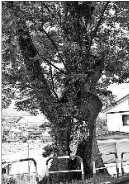
▲写真 F-004 中郷小学校のフジキ (写真・石田徹)