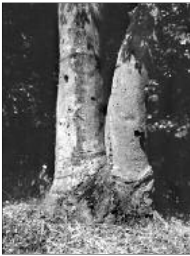
▲写真 KM-004 加茂神社のクロガネモチ (写真・Web 画像)