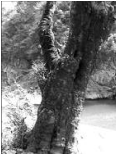
▲写真 KM-007 平底下のクロガネモチ (写真・Web 画像)