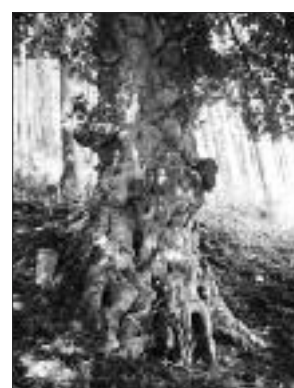
写真 M-003▶ 加波神社跡のモチノキ (写真・Web 画像)