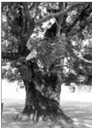
▲写真 S-015 あらい 阿山小学校のセンダン