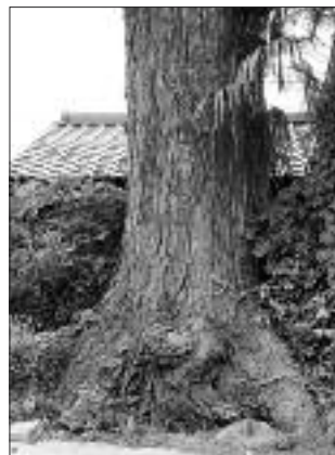
▲写真 S-016 はらだてい 原田邸のセンダン (写真・Web 画像)