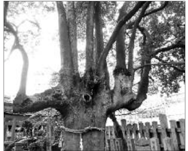
▲写真 KM-009 満足稲荷神社のもちの木 (写真・Web 画像)