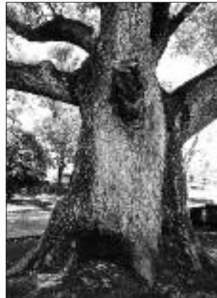
▲写真 S-013 あらい 栗須小学校のセンダン (写真・Web 画像)