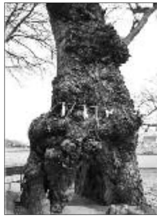
▲写真 S-008 おうじ 王子神社のセンダン