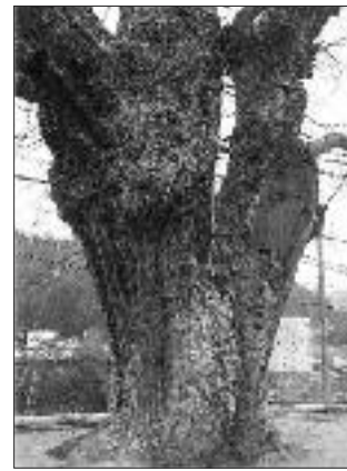
▲写真 S-010 なかざんじ 中山路のセンダン