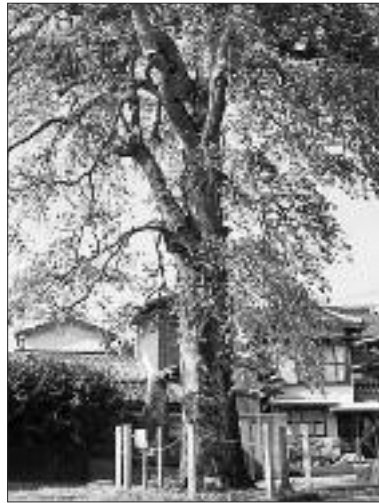
▲写真 KM-008 西福寺のクロガネモチ