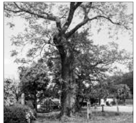
▲写真 S-018 とが 東河小学校のセンダン (写真・Web 画像)