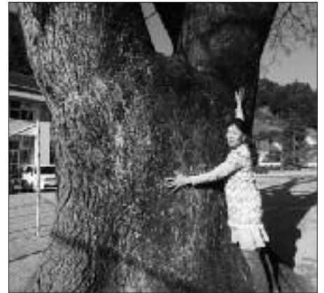
▲写真 S-014 おおさき 大崎小学校のセンダン (写真・Web 画像)