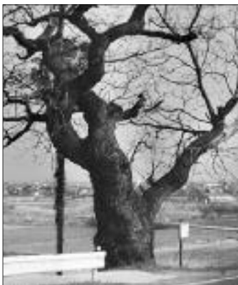
◀写真 S-004 じっぽうじ 実報寺のセンダン 実報寺は地名。 (写真・Web画像)

根元が大きく広がる樹形で、幹週数字が大きく出るが、巨大感はない。近くに保育所と小学校がある。