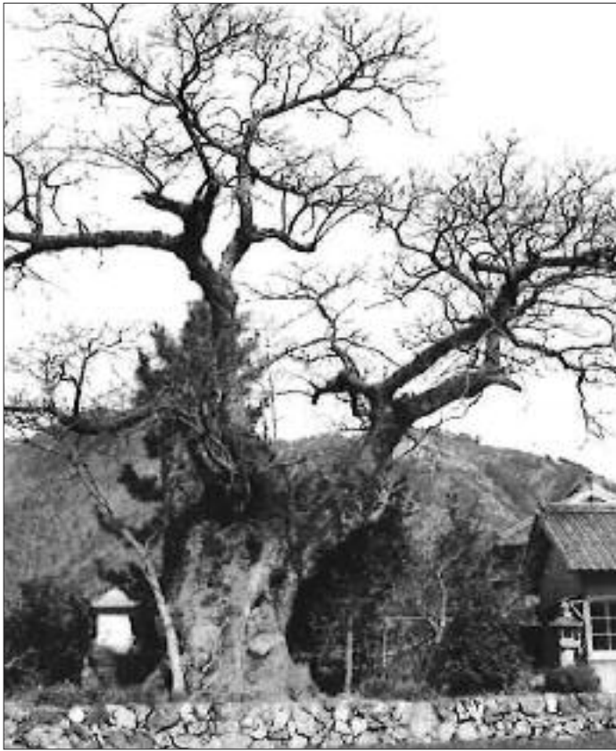
▲写真 S-001 旧日本一のセンダン 枯死・木部の大センダン 昭和43年頃撮影。昭和60年の台風で破損。