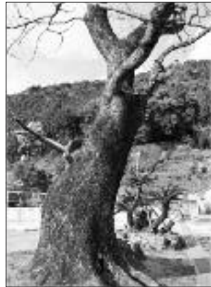
▲写真 S-012 ほりやま 葉山小学校のセンダン