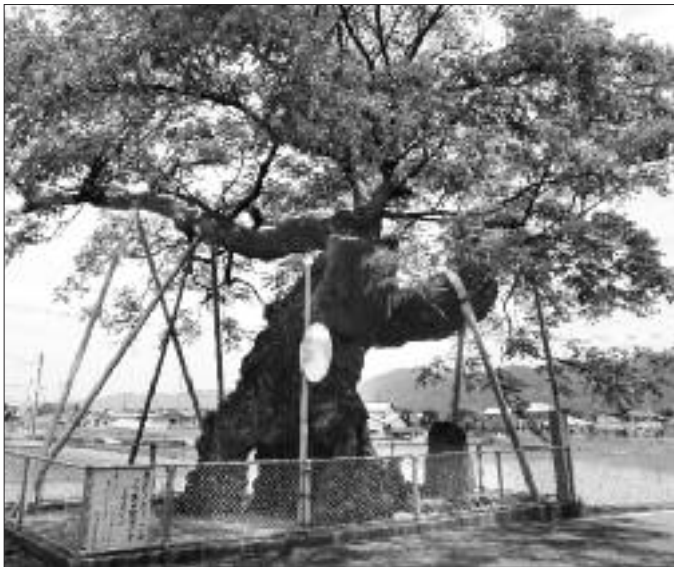
▲写真 S-003 のがみ 野神の大センダン

確認できる幹周6m台の、愛媛県東予市の「実報寺のセンダン」は、幹周6.23mで、琴平の大センダンに及ばない。この結果から、琴平の大センダンを日本一に認定した。