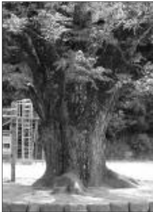
▲写真 S-011 たまゆ 玉湯小学校のセンダン (写真・Web 画像)