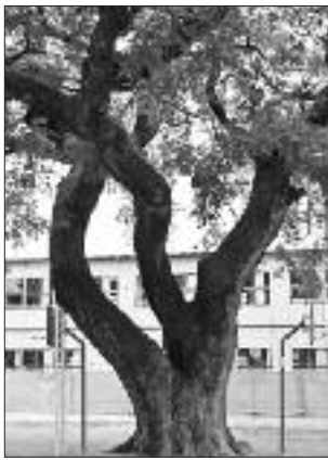
▲写真 S-007 けんしょう 建昌小学校のセンダン