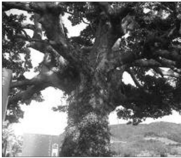
▲写真 KM-005 三根郷のクロガネモチ (写真・Web 画像)