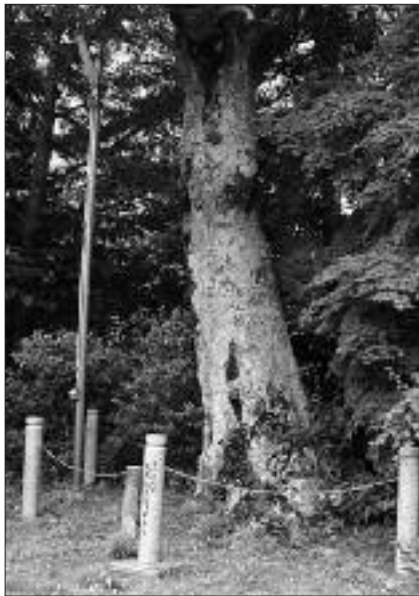
▲写真 F-003 たかくら 高座神社のフジキ (写真・谷田元彦)