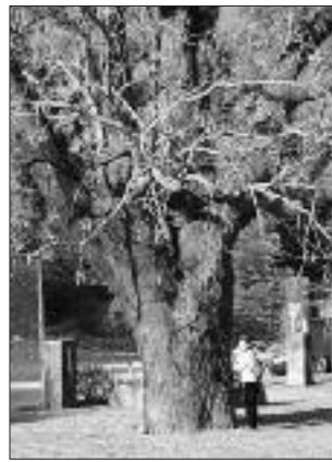
▲写真 S-009 さかもと 坂本のセンダン (写真・Web 画像)