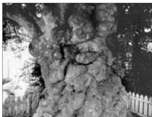
◀写真 M-002 飯田のモチノキ (写真・Web 画像)