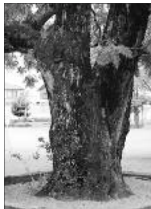
▲写真 S-017 あらい 笠間小学校のセンダン (写真・Web 画像)