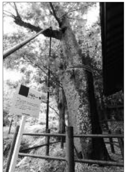
写真 F-007▶ おおのだ 大野田のフジキ 伊勢二ノ宮神社拝殿横に立つ。