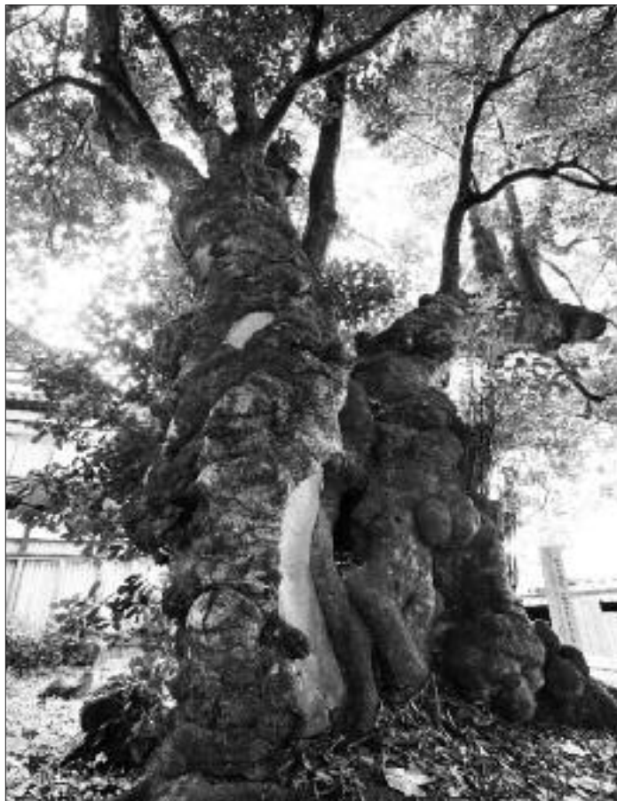
◀写真 M-001 日本一のモチノキ