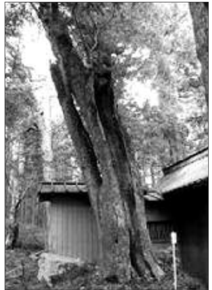
▲写真 F-005 三輪神社のフジキ (写真・Web 画像)