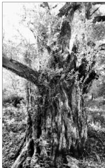
写真 TK-004▶ かかやま 耀山のカツラ 古株更新の樹形である。 (写真・Web 画像)

画像を見ると、5m で主幹の他数本の分岐幹が確認される。下部を観察すると、古株更新での樹形である事が想像される。近年、分岐幹の一本が破損している。(写真・Web 画像)