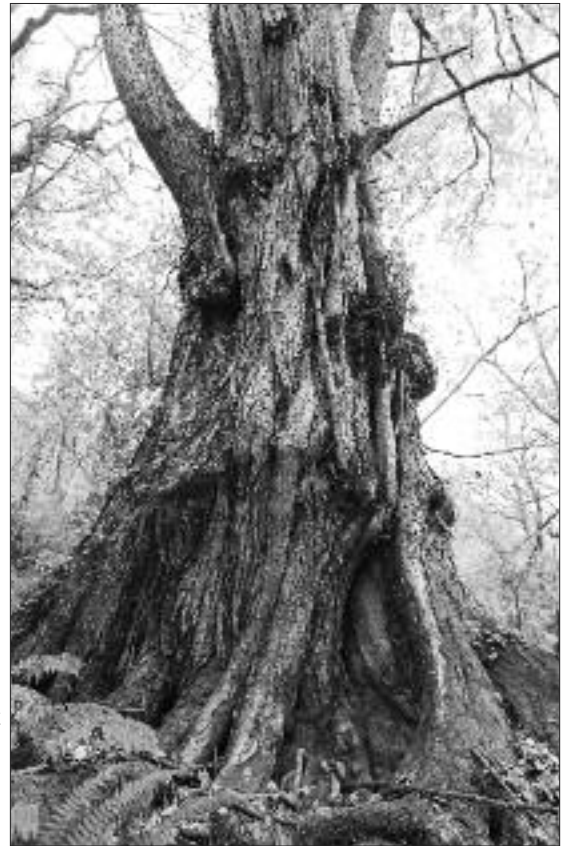
写真 TK-007▶ みくら 見倉のカツラ

向川寺境内の開かれた斜面際に立ち、斜面下に向かって大きく根を張っている。上部は1.5m程の根上り状になる単幹樹で、古株更新の可能性はある。