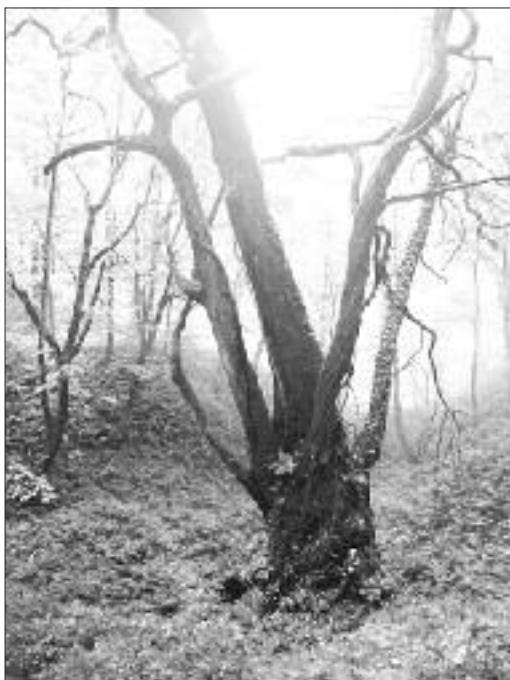
◀写真 TK-001 日本一の単幹カツラ おおかわ 大川のカツラ