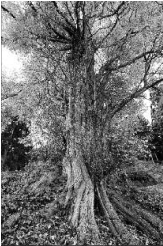
◀写真 TK-006 こうせんじ 向川寺の大カツラ

向川寺境内の開かれた斜面際に立ち、斜面下に向かって大きく根を張っている。上部は1.5m程の根上り状になる単幹樹で、古株更新の可能性はある。