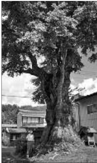
▲写真 TK-009 まぎたいら 槇木平のカツラ

このすぐ上部に見倉のトチノキがある。トチノキが大きいため、見過ごされるが、単幹カツラとしては見事である。根元に古株の痕跡が見られ、古株更新の単幹樹である。