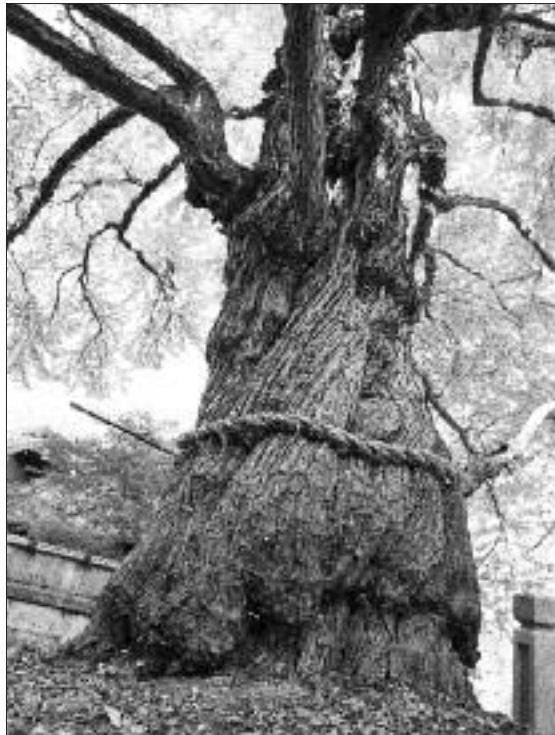
◀写真 TK-010 あいぜん 愛染カツラ

北向厄除観音の霊木として、信仰と伝説にまつわる巨木。境内の片隅にある「愛染明王」とこのカツラを題材にして描かれた川口松太郎の「愛染かつら」によって有名になり、縁結びの霊木として知られる。ひこばえを剪定しながら仕立てた単幹樹である。