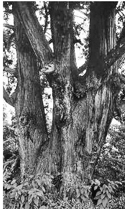
澤山神社の大杉(新潟県)