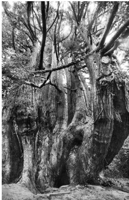
高井の千本杉(奈良県)

巨木 DB では幹周 25m。分岐幹の合計周と思われる。実生伏条の分岐幹で、本来の幹周は根元の部分。