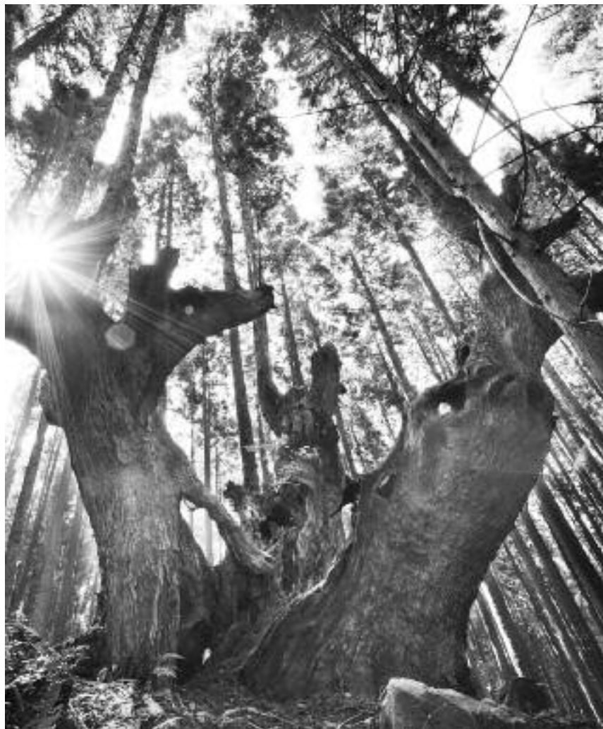
みつまたかぶすぎ 三股株杉 評価 C 株周 M9.6m(0.5m 2007) 株杉群の内最大株