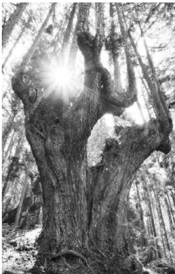
さんごかぶすぎ 珊瑚株杉 評価 C 幹周 M6.35m(1.3m 2007)